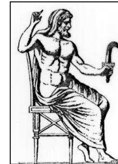
Kronos, jüngster Sohn von Gaia, der Mutter Erde, mit seinem umgebogenen Schwert

Mit Kronos kam das „Goldene Zeitalter“, denn Kronos war der Friede. Er verteilte die Planeten und die Wochentage an seine sechs Geschwisterpaare und sich selbst. Ein wunderbares Zeitalter muss es gewesen sein, auf der ganzen Welt lebten die Menschen ohne Krieg, beim Streit gab es immer Lösungen, sie lebten nach den Gesetzen der Natur, sie lebten in Frieden und ohne Not. Deshalb nannte man diese Zeit „Das Goldene Zeitalter“.